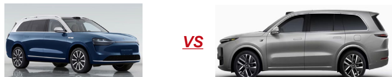
图：问界M9重新定义智驾豪华