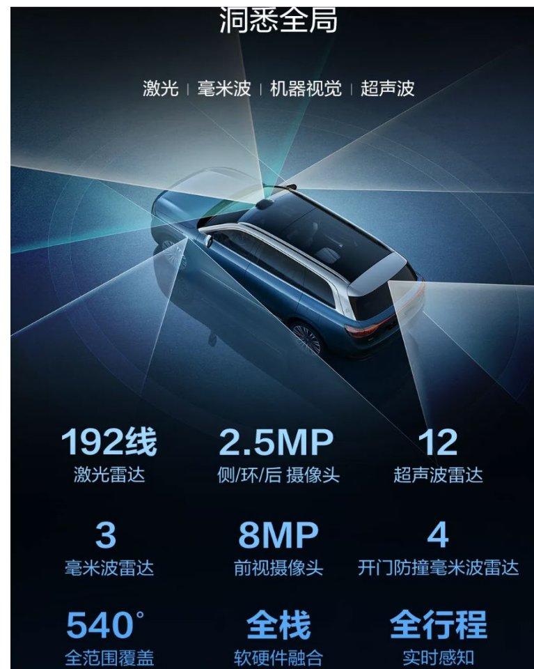
图 问界M9融合感知系统