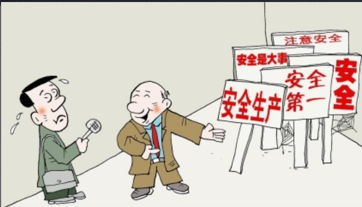
——我们厂一直很重视安全生产！ 唐春成 作