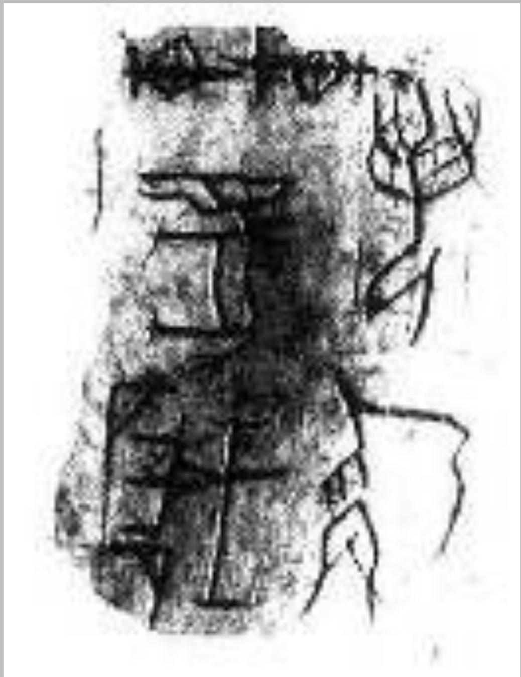
刻在牛骨上的卜辞 商代后期