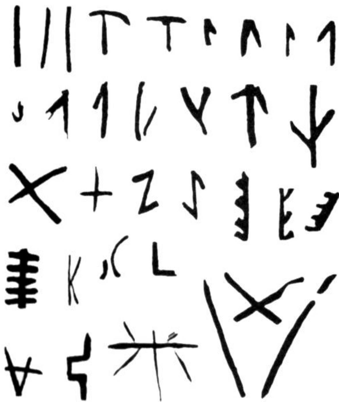
西安出土 半坡彩陶 刻画符号