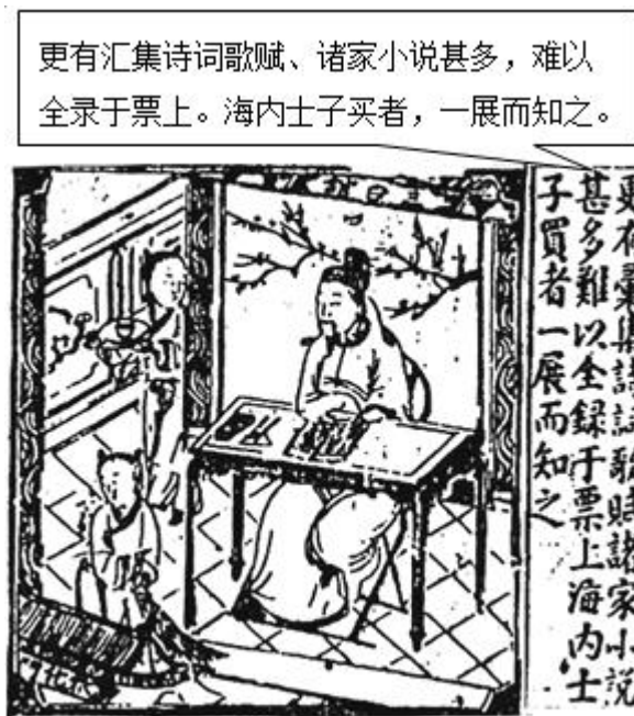
小说和诗词曲赋丛编《万锦情林》封面局部

6. (2022·北京卷)下图的封面形式常见于明代刻本书籍，图中读书的人物为该书编刻者。该图可以佐证明代( )